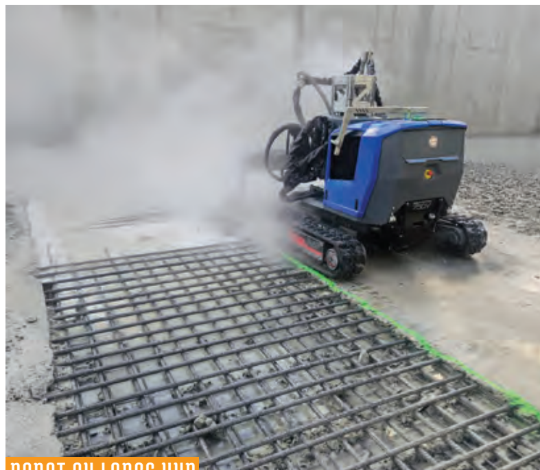
ROBOT OU LANCÉ UHP